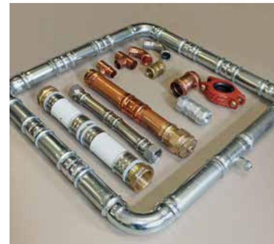
Fittings und Rohre | Fittings and pipes