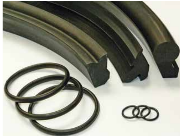
Dichtungen | Sealing elements