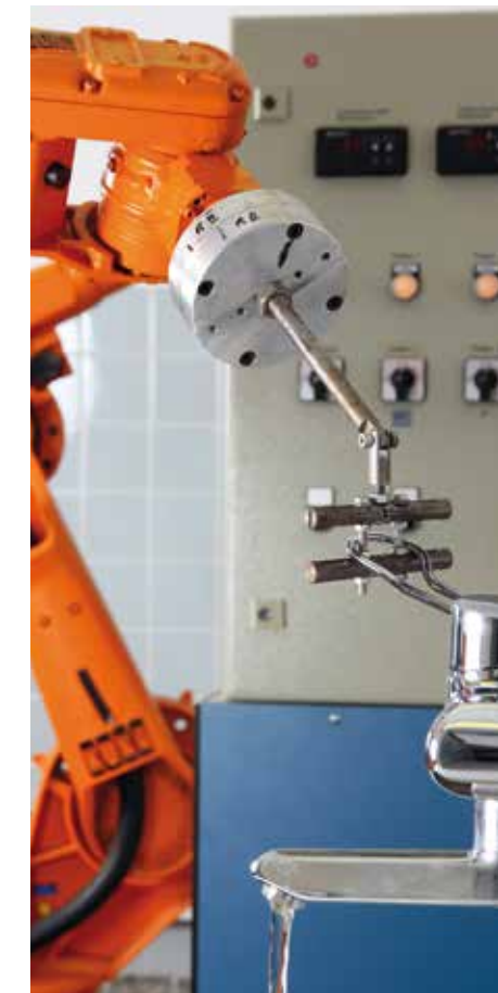
Prüfung der mechanischen Dauerbeständigkeit an einer Sanitärarmatur am Beispiel eines Einhebelmischers | Mechanical endurance test of a sanitary tap in form of a single lever mixer

Testing expertise for the client's benefit