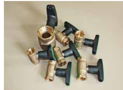
Kugelhähne | Ball valves