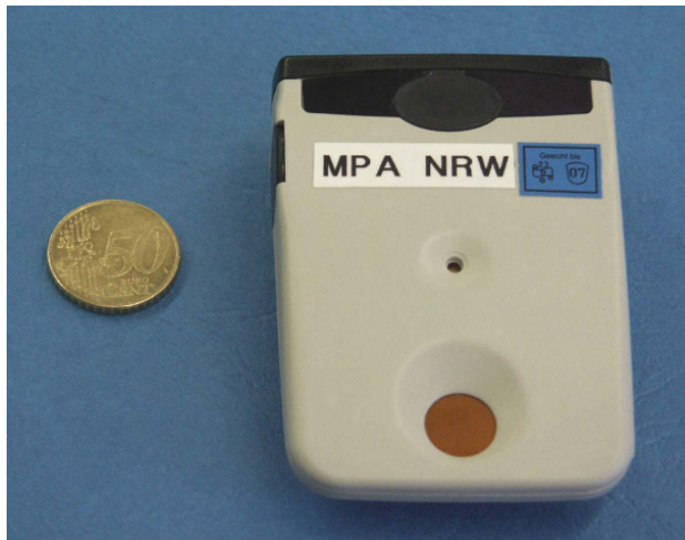
Bild 1: EPD-Mk2. Beim EPD-G entfällt das Betafenster. D.h. das kupferfarbene Feld im unteren Teil des Dosimeters (siehe auch Bild 2).